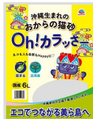
おからの猫砂 Oh!カラッサー *パッケージデザイン:2種類

豆腐を生産する過程においては、「おから」が発生しますが、日本全体として「おから」の5～9%が廃棄 *1 されています。沖縄県は豆腐の消費量が多く、那覇市は都市別の豆腐の支出金額では全国1位 *2 という現状にあって、沖縄県では豆腐の副産物「おから」は大部分が産業廃棄物として処理されています *3 。