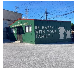
沖縄工場 事務所 外観